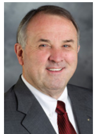
2013～2014年度 国際ロータリー会長

世界には何百万もの恵まれない子どもたちがいることを、私たちは知っています。だからこそ、私たちは基本的教育と識字率向上をロータリーの奉仕の優先事項にしています。今月は識字率向上月間です。地球の裏側にいる子どもであれ、まさに自分の町にいる子どもであれ、私たちが行っている子どもの識字率向上に対する支援が、どんなに素晴らしい贈り物かを、あらためて考えてみましょう。