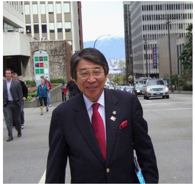
バンクーバー RC100 周年記念行事 バンクーバーダウンタウンにて

(スピーチ翻訳を提供して頂いた RI 第 2680 地区 大室 ガバナーに感謝申し上げます。)